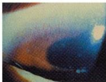
かくまくけっかんしんせい 角膜血管新生