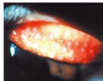
きょだいにゆうとうけつまくえん 巨大乳頭結膜炎